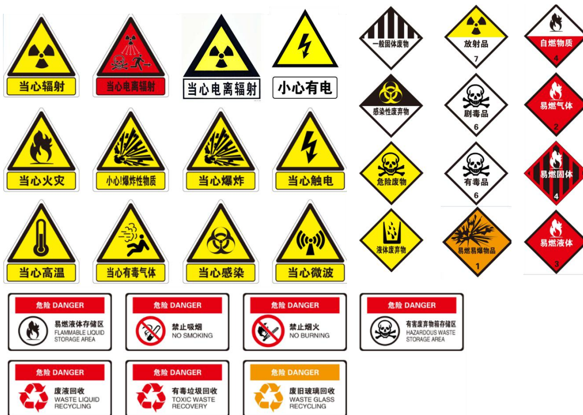
危险化学品以及标识说明