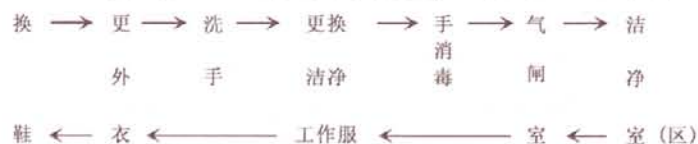
图 5.2.4 医药洁净室(区)人员净化程序