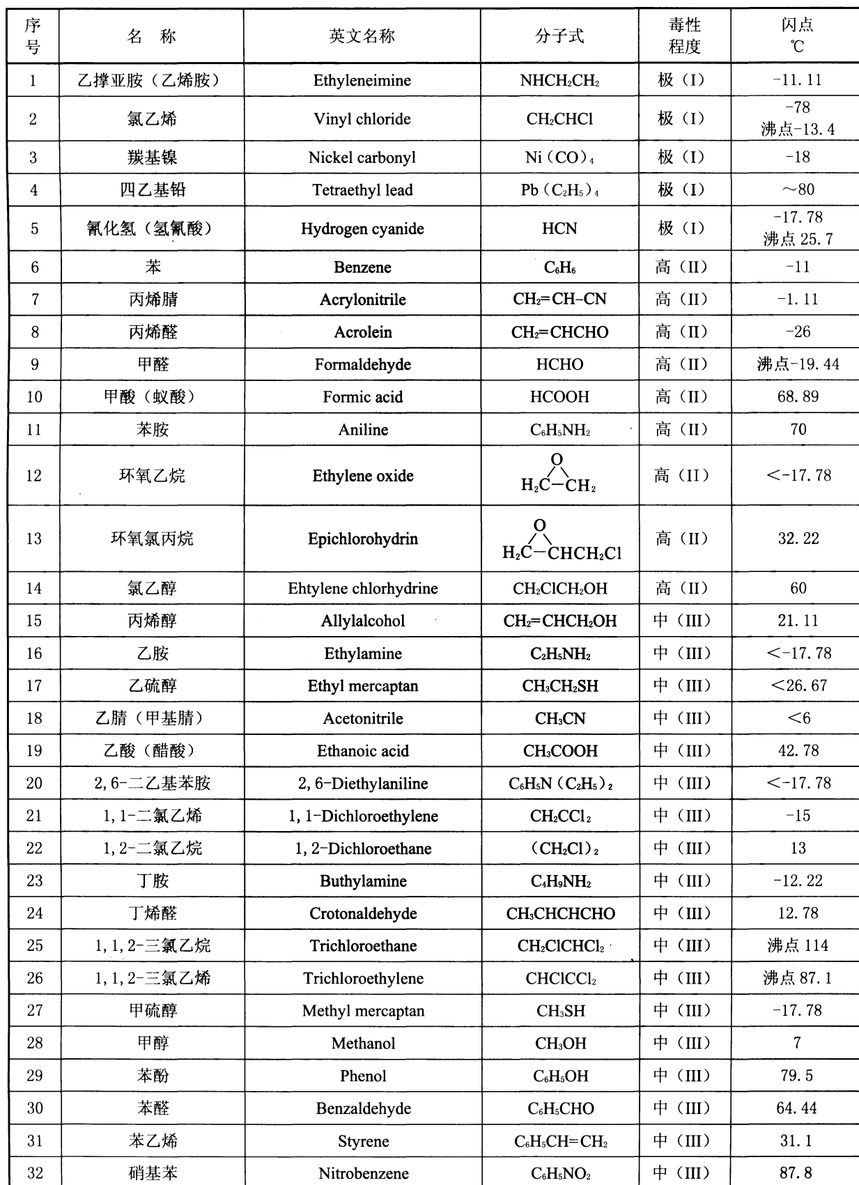
表 1 常见易燃和可燃有毒液体毒性程度举例