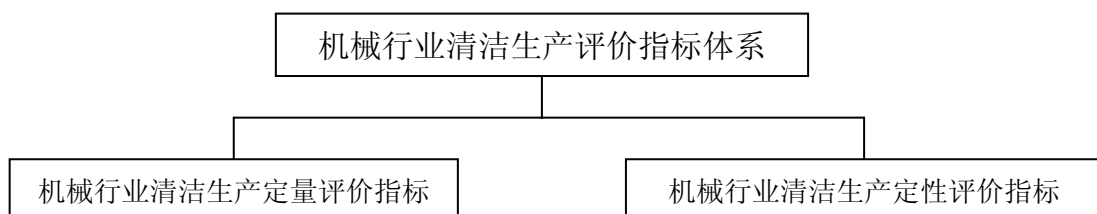
图1 机械行业清洁生产评价指标体系结构