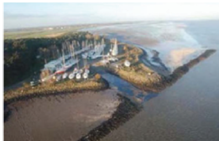
事故所涉及的区域