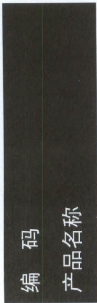
图 E.3 特异性靶器官毒性一次接触类别 3 的标签示例