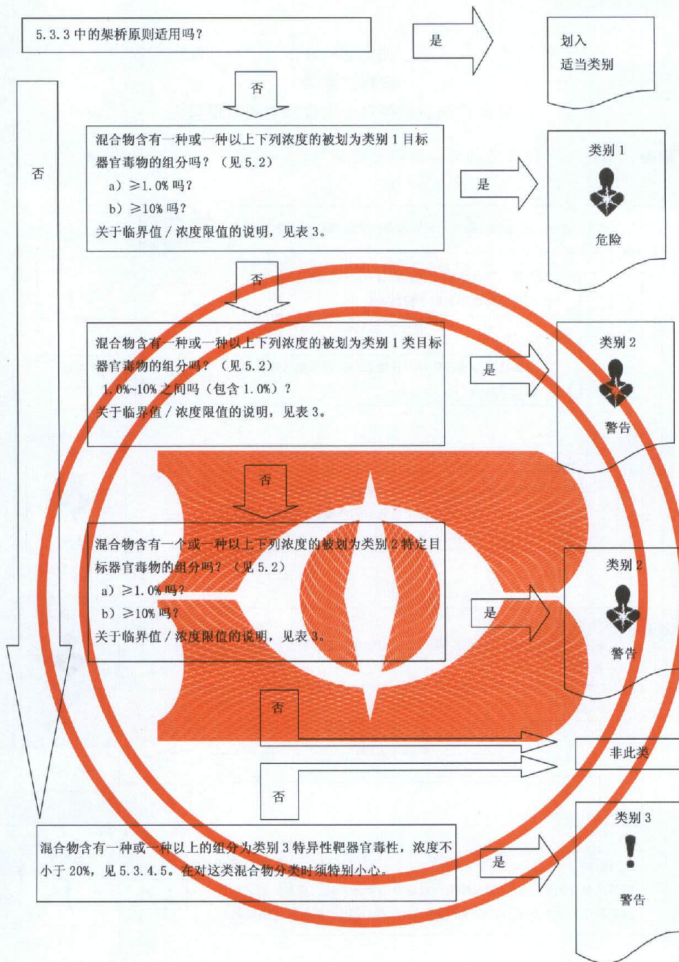
图 A.1 (续)