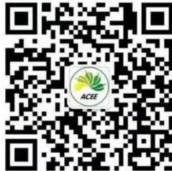
生态环境部环境评估中心