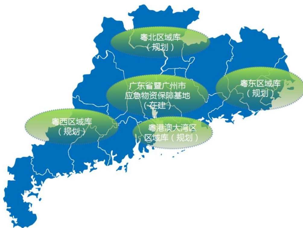
图3 省级应急物资保障基地、区域库布局示意图

统筹仓储设施建设布局。根据各地地理气候、人口规模、经济发展、产业结构的差异，统筹全省各级应急物资仓储设施建设布局，实现不同区域、不同品类物资差异化保障。在粤港澳大湾区重点区域以及多灾易灾、偏远地区推进综合性应急物资区域库建设，强化区域辐射效应，提升应急响应效率。