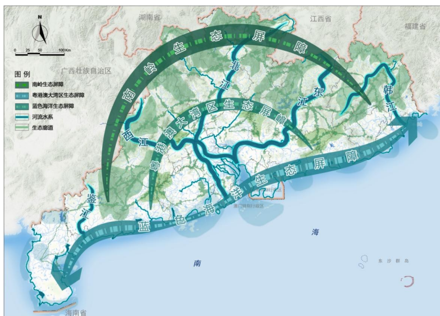
广东省国土空间生态安全格局示意图

坚持山水林田湖草沙生命共同体理念，大力实施重要生态系统保护和修复重大工程，不断提升生态系统质量和稳定性，逐步形成生态保护修复新格局。