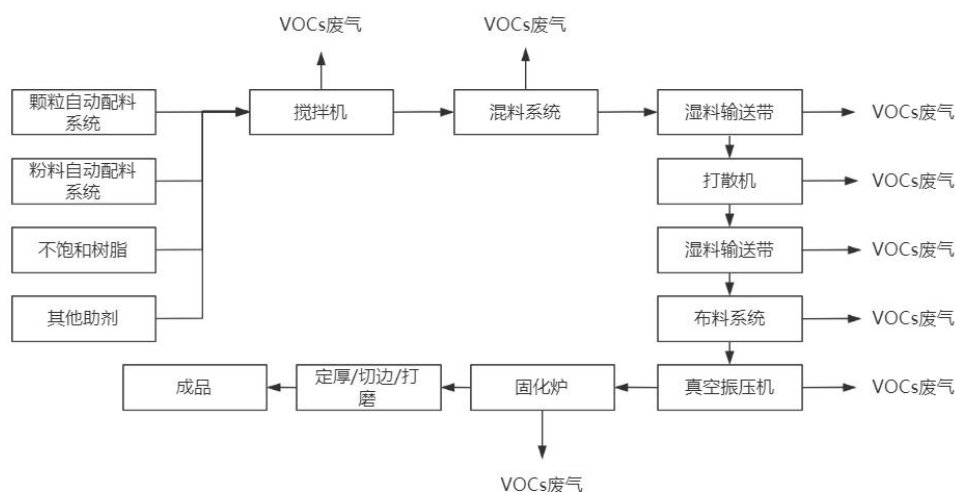
图 4-2 人造石英石生产工艺流程图

人造石英石制造工艺如图 4-2 所示，包括称料、投料、搅拌、布料、压制、固化（烘干）等工序，主要使用的原辅料为石英石（砂）粉、色粉、不饱和聚酯树脂以及固化剂等，通过固化炉加热到 60~80℃持续烘烤 40 分钟左右进行固化，在固化炉加热条件下会产生苯乙烯、苯、二甲苯等多种有机废气。