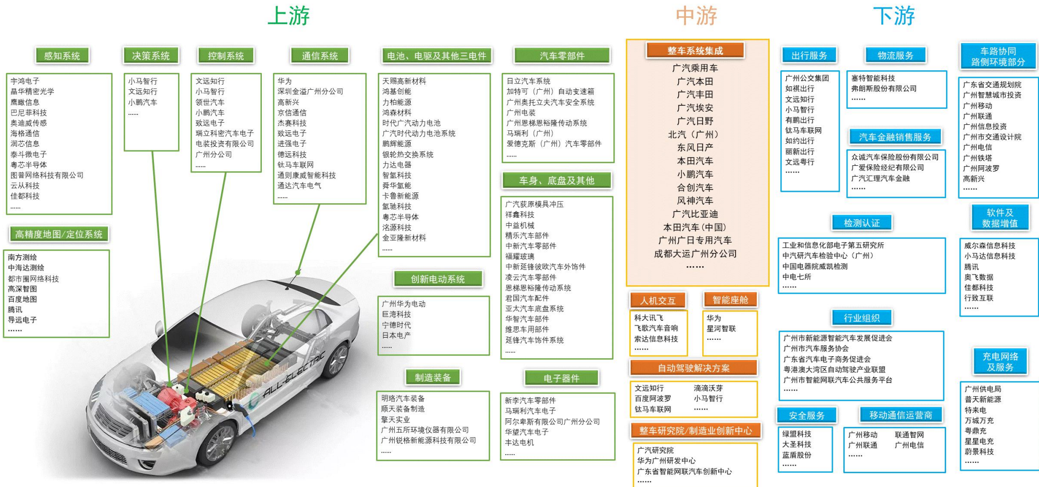
图 2 广州市智能与新能源汽车产业链全景图