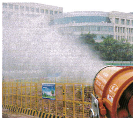
施工区域抑尘喷雾设备