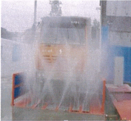
车辆自动冲洗系统

三 施工现场每个出入口必须配备车辆冲洗设施，建立冲洗制度并设专人管理，落实一车一杆的放行制度，严禁车辆带泥上路。