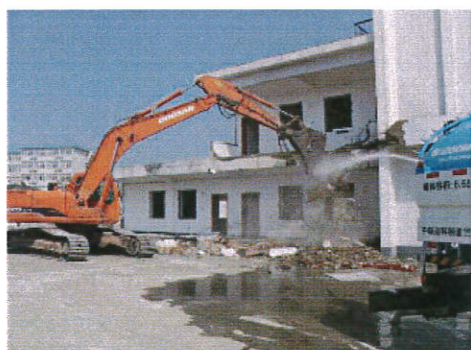
拆除过程喷水抑尘

八 拆除建筑物、构筑物时，必须采用围挡隔离、喷淋、洒水、喷雾等降尘措施，及时清运拆除的建筑垃圾。严禁敞开式拆除和长时间堆放建筑垃圾。