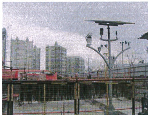
在线监测和视频监控集成系统