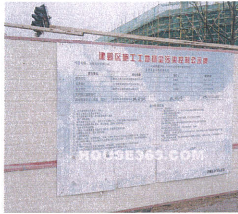
工地扬尘防治制度公示