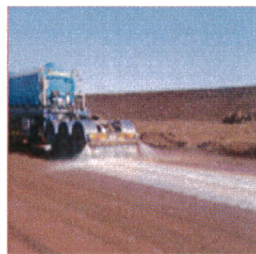
喷洒长效道路抑尘剂