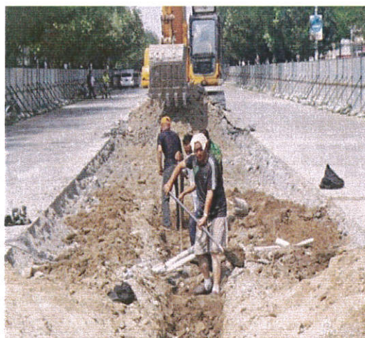
道路工程两侧设置围挡

二 施工现场出入口和场内主要道路、加工区、办公区、生活区必须用水泥或者沥青进行硬化，硬化后的地面应进行清扫洒水，保持整洁无浮土、积土，严禁使用其他软质材料铺设。不具备条件的必须喷洒长效道路抑尘剂。