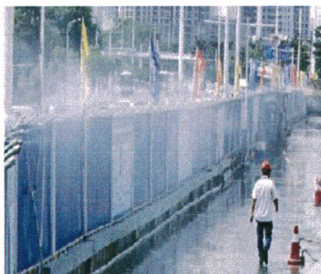
近地面围挡喷淋系统

十二 施工现场必须建立喷淋、洒水、清扫抑尘制度，配备相关设备。保持作业面湿润，并有专人负责。污染天气时相应增加洒水频次。施工单位应当在施工工地对扬尘污染防治措施、制度、责任人等信息进行公示。