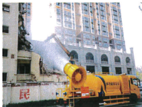
拆除过程喷雾抑尘车