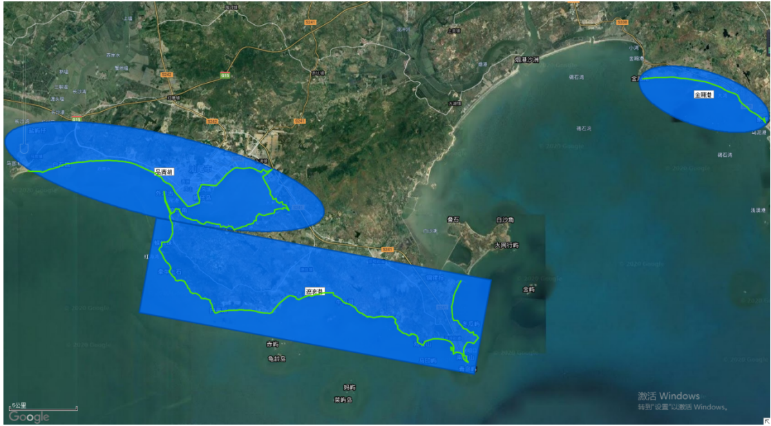
图 1 汕尾市“十四五”拟建设美丽海湾位置分布图