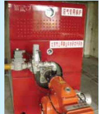
运行中的中国高安屯垃圾填埋场燃气锅炉

高安屯垃圾填埋场是一个由北京市朝阳区垃圾无害性处置中心（Garbage Innocent Disposal Center）所有并运营的卫生垃圾填埋场。2007年，美国环保署（U.S. EPA）对此进行了分析仪器环境试验，以评估要回收可用垃圾填埋气（LFG）的品质，并且编写了有关在该场点扩大垃圾填埋气（LFG）利用潜在性的可行性前期研究报告，2010年，美国环保署（U.S. EPA）提供了随后的气体采集系统技术协助和监督，以识别该场点如何能够提高气体采集的效率，从而增加可用于生产能源气体的数量。截至2010年8月，气体采集系统包含150口抽采井，此为从被动通风口转化而成。所有者起初于2007年安装了一台500千瓦（kW）的往复式内燃机，以为该场点上的沥出物处理厂发电，然而后来又于2008年加装了第二台500千瓦的内燃机。这一现行项目通过发电可减少垃圾填埋气（LFG）排放达37,100吨CO 2 当量，通过直接使用可减排500吨CO 2 当量。到2011年1月，另外两台内燃机将加装并投入使用，届时其总发电能力将达到2.5兆瓦（MW）。所有者计划到该垃圾填埋场关闭之日最终将发电能力提高到4兆瓦。