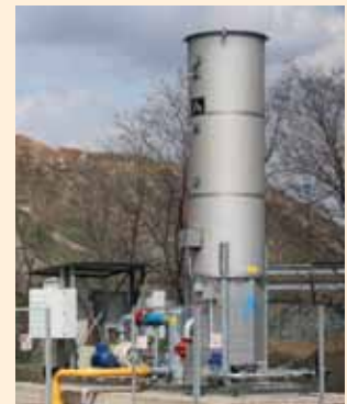
运行中的乌克兰马里乌波尔垃圾填埋场气体燃烧器

2008年8月和9月，美国环保署（U.S. EPA）在该垃圾填埋场进行了分析仪器环境试验，其结果表明这里的垃圾填埋气（LFG）回收率能够支持建立焚烧和/或发电项目。2009年2月，马里乌波尔市政府将该市的两处垃圾填埋场的垃圾填埋气（LFG）抽采和利用项目授予了TIS Eco Company。全球甲烷行动（GMI）项目网络成员TIS Eco Company，与科学工程研究中心（SEC）Biomass合作，于2009年6月在第一个垃圾填埋场开始了建设施工工作。该系统于2010年投入运行。2010年8月，国家环境投资局（National Environmental Investment Agency）签发了“乌克兰马里乌波尔市固体垃圾填埋场甲烷抽采与回收”批文，以开展联合实施项目。